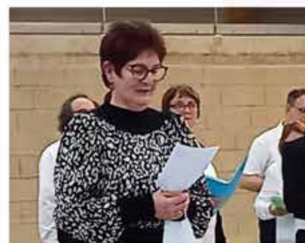
La présidente du RACLS remercie l'assemblée pour sa présence au concert du 2 avril.

À rappeler que la chorale, qui se compose maintenant de 25 choristes, répète tous les mercredis de 19 h 00 à 20 h 30 à la salle polyvalente du village.