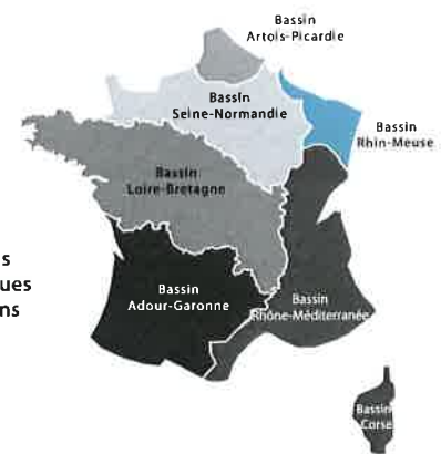
Les 7 bassins hydrographiques métropolitains

Le bassin s'étend sur 32 000 km 2 (6% du territoire national métropolitain) et compte 4,4 millions d'habitants, 8 départements et 3 230 communes.